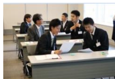
ディスカッション